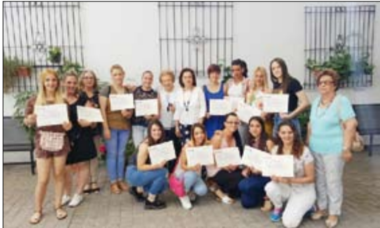
Participantes en el curso con miembros de la Conferencia.

La Conferencia de San Vicente de Paul de la parroquia de Santa María de Mérida ha organizado un curso de dependienta de comercio. Son ya 9 años que la Conferencia de Santa María viene realizando este curso, con muy buenos resultados. "El objetivo que queremos alcanzar -aseguran- es que mujeres mayores de 16 años consigan formarse en un oficio para poder acceder a un empleo en el mercado laboral, tan difícil hoy en día para todos, y aún más para la mujer con escasa formación".