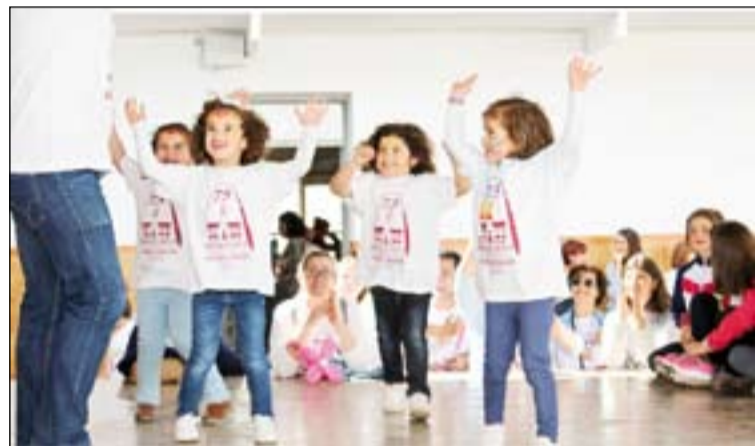
Arriba celebración institucional del 75 aniversario, abajo celebraciones con participación de los niños.

tiguos Alumnos. Durante todo el día se pudieron visitar todas las aulas y espacios del centro, así como las distintas exposiciones de trabajos sobre el 75 aniversario y la exposición de cartas de don José Hidalgo. La jornada finalizó compartiendo un aperitivo en el que se hizo entrega de la insignia del colegio a diferentes miembros que han sido una parte importante de la comunidad educativa.