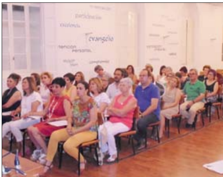
Alumnos de la Escuela de Formación básica en la entrega de diplomas.

Los alumnos que finalizan esta etapa formativa re-