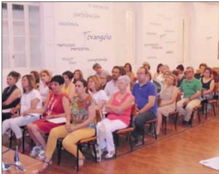
Alumnos de la Escuela de Formación básica en la entrega de diplomas.

Los alumnos que finalizan esta etapa formativa re-