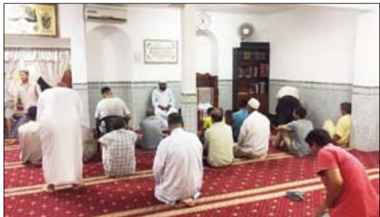
Comunidad musulmana de Badajoz en un momento de oración.

Según destaca José Moreno Losada, Delegado Episcopal para el Ecumenismo y el Diálogo Interreligioso, que representó al Arzobispo, "no hay mayor arma frente a los fundamentalismos extremos, radicales y violentos, utilizados por otros poderes más anónimos pero muy macabros, que la de